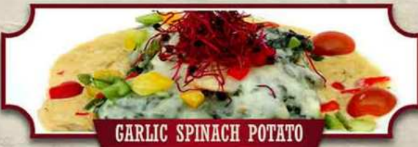
GARLIC SPINACH POTATO

Gefüllt mit gezogenem Putenfleisch, Romana-Salat, Paprika, Zwiebeln, Mais und Käse 1,d , dazu French Fries und BBQ-Sauce