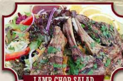
LAMB CHOP SALAD