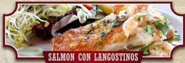
SALMON CON LANGOSTINOS