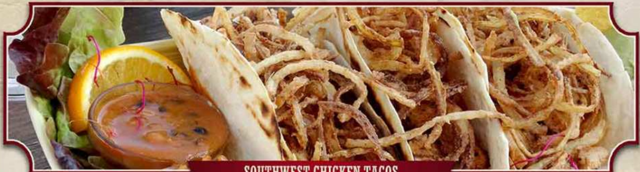
SOUTHWEST CHICKEN TACOS

Gefüllt mit Hähnchenbrust, Avocado, Palmenherzen, Kaktusblättern, Mais, Paprika, Tomaten und Zwiebeln, überbacken mit Käse l,d , Sour Cream l,d und Chilisauc e , dazu unser Mexiko-Reis und bunte Bohnen