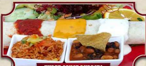
THREE SAUCE BURRITO

Rinderhack-Burrito, Roastbeef-Enchilada und Crispy Taco mit Putenfleisch, dazu unser Mexiko-Reis und bunte Bohnen